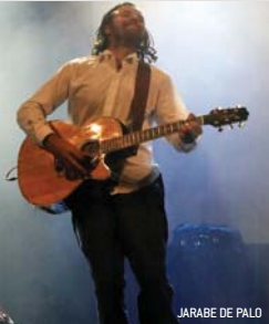
JARABE DE PALO