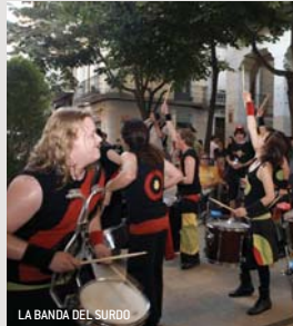
LA BANDA DEL SURDO